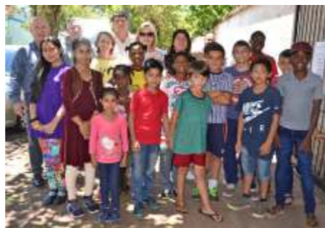
VOLUNTÁRIOS COM CRIANÇAS E JOVENS DA ESCOLA

Em novembro de 2018, tivemos a grata satisfação de dar início a um Projeto de Apoio à Integração de Alunos Estrangeiros e Brasileiros, em situação de vulnerabilidade, na Escola Estadual de Ensino Fundamental Fernandes Vieira. Muitas famílias de imigrantes moram nas redondezas e enviam as suas crianças para estudar naquela escola. Num espírito de parceria, a escola, a comunidade, o grupo OASE Priscila, a Associação de Karatê Alto Taquari e o Conselho Nacional de Igrejas Cristãs pretendem atingir um número de 43 crianças, entre brasileiros e estrangeiros, de 7 a 14 anos, com aulas de karatê, duas vezes por semana, durante um ano, pelo menos. Entre os objetivos está a promoção do