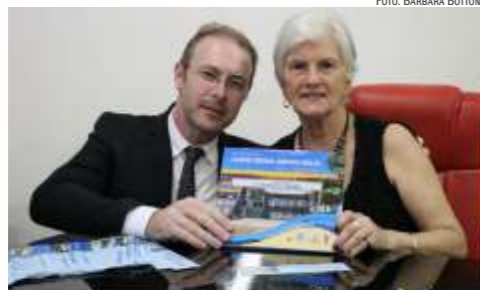
EX-DIRETORA ENTREGA O LIVRO AO ATUAL DIRETOR