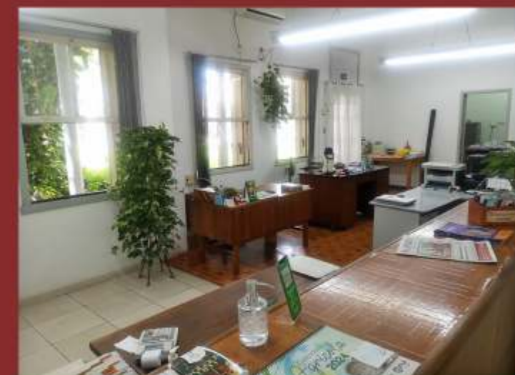
SALA ONDE FUNCIONA A SECRETARIA HOJE