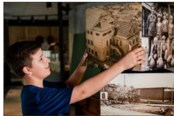
2024 SERÁ MARCADO PELOS 200 ANOS DA IMIGRAÇÃO

Com base nisso, ao longo do ano de 2024, três importantes acontecimentos serão celebrados junto às comunidades evangélica e escolar: os 200 anos da presença luterana no Brasil, os 200 anos da imigração alemã e os 90 anos da fundação da Educação Infantil do CEAT. Este terceiro marco também tem ligação com a Comunidade Evangélica, já que o Kinder-